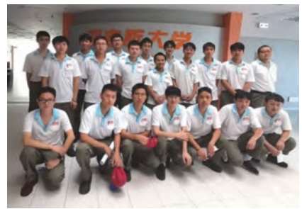
2023年昆山實習生團建活動